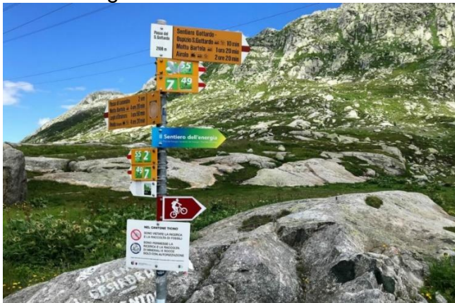
Von der 4 Tageswanderung im Gotthardgebiet

Unsere aktuellen Wanderungen werden auch im Mitteilungsblatt der Gemeinde Zollikofen publiziert. Lasst euch inspirieren und erzählt die Anlässe weiter!