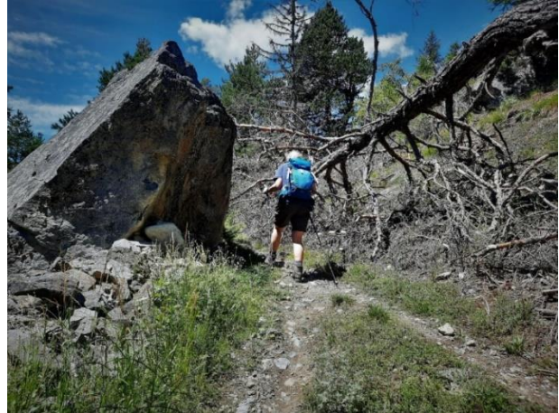
Wanderung Jeizinen - Albinen