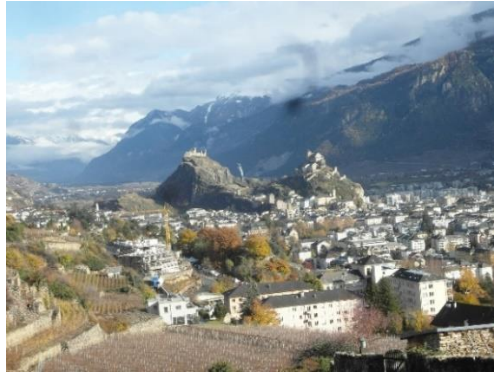
Blick auf Sion mit Valère und Tourbillon