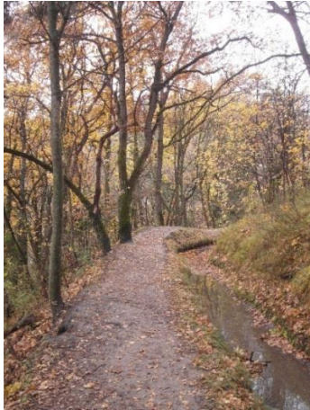
Bisse de Lentine